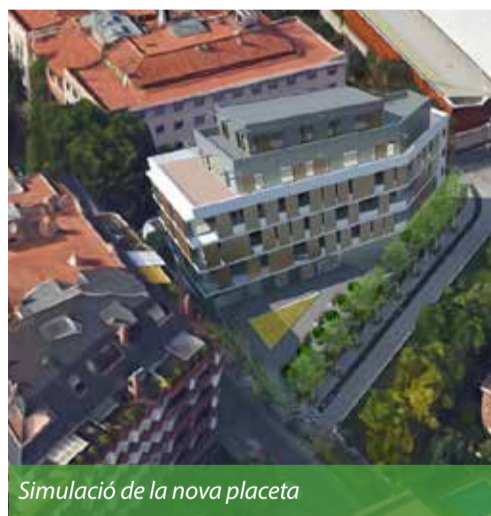
Simulació de la nova placeta

Això farà que hi hagi una continuïtat a la zona, que sigui més uniforme i que la futura construcció s'integri més bé al barri.