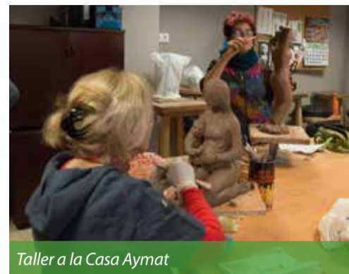
Taller a la Casa Aymat

De moment, a la Casa Aymat, els cursos conviuen amb l'exposició permanent del Museu del Tapís Contemporani, que, en un futur, es traslladarà a Can Quitèria, un espai que es dedicarà específicament a l'estudi, el foment i la difusió de l'art tèxtil.