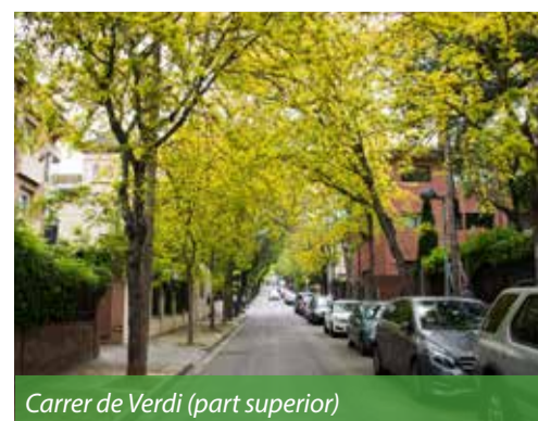
Carrer de Verdi (part superior)

En una segona fase, es previst que també s'actui als carrers situats a l'oest de l'avinguda de Gràcia, com el carrer de Verdi i de les Tres Places, entre altres.