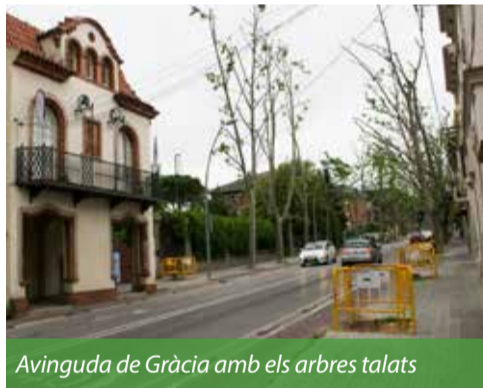
Avinguda de Gràcia amb els arbres talats

Aquesta primavera, l'Ajuntament s'ha vist forçat a talar quatre plataners ubicats a l'avinguda de Gràcia a causa de l'enverinament que han patit.