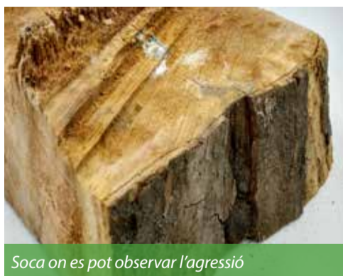
Soca on es pot observar l'agressió

Segons els tècnics municipals, aquests quatre plataners van ser objecte d'una agressió durant la primavera del 2016, quan, en un acte vandàlic, se'ls va perforar amb una barrina i se'ls va injectar productes fitotòxics.