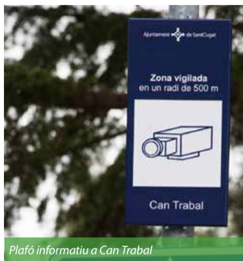
Plafó informatiu a Can Trabal

Actualment, Sant Cugat té 144 càmeres, que serveixen, d'una banda, per controlar la seguretat a la via pública i equipaments municipals i, de l'altra, gestionar la mobilitat i el trànsit a Sant Cugat. La instal·lació de les noves càmeres s'ha dut a terme a petició de l'Associació de Veïns de Can Trabal.