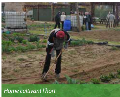
Home cultivant l'hort

Gràcies al programa "Cultiva't", el nostre barri disposa d'un hort urbà de dotze parcel·les ubicat al carrer Andana, a davant de l'estació dels FGC. L'hort, gestionat pels serveis socials municipals, té una vocació d'integració social i és per això que els seus usuaris són persones en risc d'exclusió social. Properament, ampliarem aquest hort.