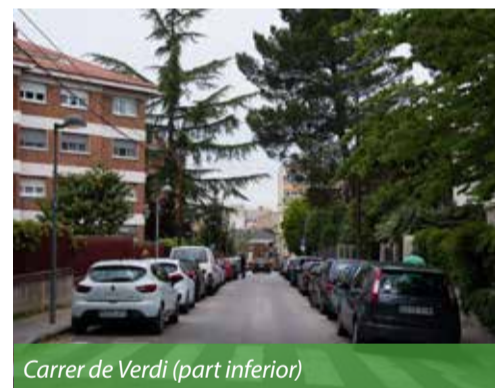
Carrer de Verdi (part inferior)

Amb l'objectiu de fer de Sant Cugat una ciutat accessible i amb un entorn de qualitat, l'Ajuntament ha consensuat amb els veïns l'arranjament de les voreres i les calçades del barri de l'Eixample Sud. D'aquesta manera, es pretén prioritzar el vianant de manera que gaudeixi de més espai, cosa que beneficiarà especialment la gent gran, el pas de cotxets i les persones amb mobilitat reduïda.