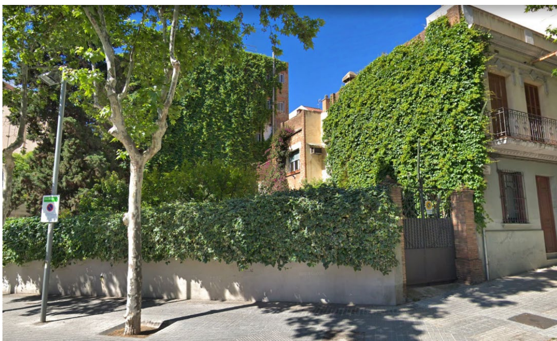
Figura 2. Exemple de paret i de tanca de pati recoberta d'heura. Rambla de Volart, Barcelona.

Alguns elements vegetals a les ciutats tenen el potencial de reduir la contaminació de l'aire, ja que faciliten la deposició de partícules i l'absorció de gasos. Entre aquests elements vegetals hi ha els murs o barreres verdes (tanques vegetals de gruix i alçada variable que separen dos espais oberts) o les parets i teulades verdes (recobriments vegetals de la façana o del sostre d'un edifici) (Figura 2).