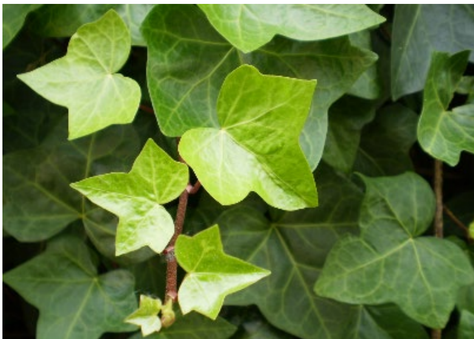
Figura 3. Heura ( Hedera helix )

carrers estrets ( Abhijith et al. 2017 ). L'efectivitat de les parets verdes per millorar la qualitat de l'aire seria molt més alta que la de les teulades verdes, i s'estima que podria arribar a reduir considerablement el NO 2 i les partícules a nivell de carrer en entorns urbans densos ( Pugh et al. 2012, Tremper et al. 2018 ). En quan a l'efectivitat de les diferents espècies vegetals, les de fulla perenne tenen més potencial per reduir la contaminació durant tot l'any ( Abhijith et al. 2017 ). Altres criteris a tenir en compte en entorns escolars inclouen la seguretat de l'espècie vegetal (absència de punxes, baixa al·lergenicitat i/o toxicitat o capacitat d'atraure insectes), que sigui autòctona i adaptada al clima i al manteniment que rebran. Falten estudis específics que determinin les característiques de les estructures vegetals que siguin més eficients per reduir la contaminació atmosfèrica en entorns escolars i en el context d'una ciutat com Barcelona.