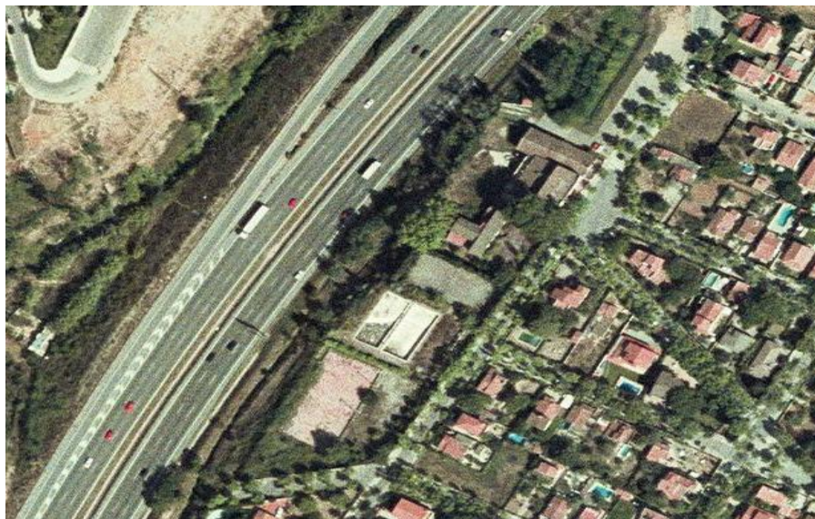
Instal·lacions esportives existents (Ortofoto any 2000)

Des de l'any 2000 la propietat ha intentat desenvolupar diferents projectes, des d'una residència per gent gran, fins a un centre sanitari-assistencial, propiciat per la trobada d'aigües termals en el subsol. L'entrada en vigor de la normativa sectorial en matèria de protecció civil va afectar aquest àmbit provocant la inviabilitat sobrevinguda dels projectes referenciats.