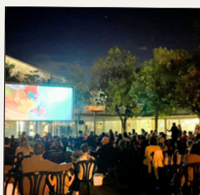
Cinema a la fresca