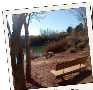
Accés a la llacuna dels Alous