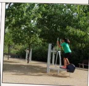
Circuit de salut amb aparells gimnàstics