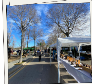
Promoure un mercat de pagès