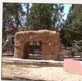
Rocòdrom d'escalada a l'entorn del Casal