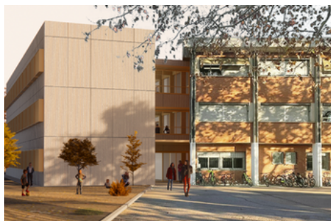
Imatge de com serà el nou edifici

Pas endavant per fer realitat el nou edifici que haurà d'acollir les aules de l'ESO de l'Institut Escola Catalunya.