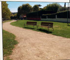
Bancs per a la gent gran i espais de trobada