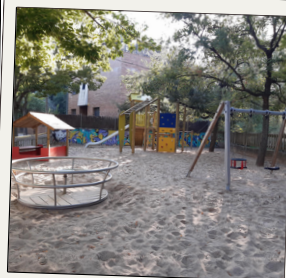
Renovar el parc infantil de la pista de Mas Gener

Dels 25 projectes escollits als Pressupostos Participatius del barri o d'àmbit general que s'ubiquen en part al barri, se n'han executat 14 .