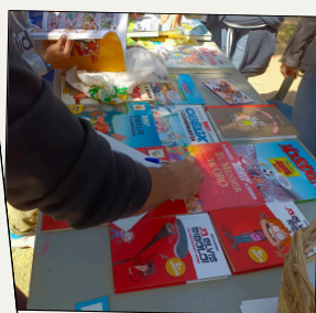
Més manga a les biblioteques