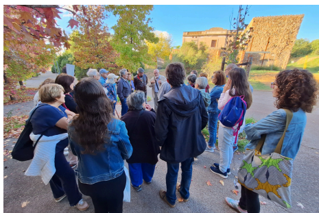
Primera passejada comunitària

Coneixes la història de Mira-sol? No et perdís, al mes de març, l'exposició de fotos comunitària que farem al Casal de Mira-sol.