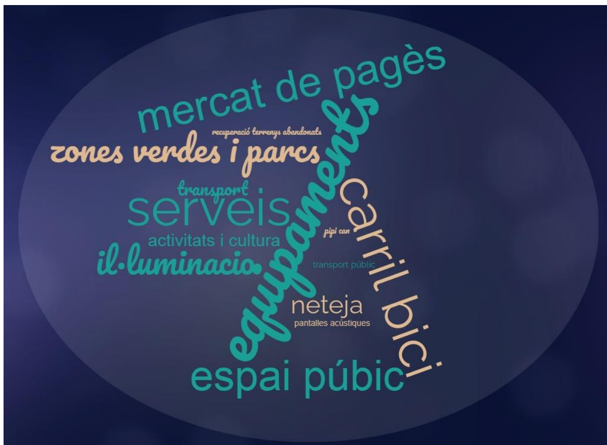
Gràfic 3. Millores als darrers anys

En relació a les millores percebudes al barri en els darrers anys, els enquestats esmenten aspectes com el mercat de pagès, el carril bici, els equipaments i les zones verdes. També s'apunten altres millores com les zones verdes i la il·luminació, entre d'altres.