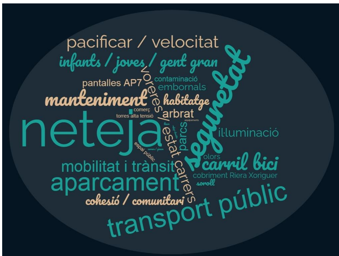
Gràfic 2. Necessitats i problemes

Pel que fa a necessitats i problemes del barri, els aspectes més citats són la neteja, la seguretat, el transport públic i la mobilitat i el trànsit. Altres aspectes que preocupen són l'aparcament, el manteniment, l'estat dels carrers i les voreres i el carril bici.