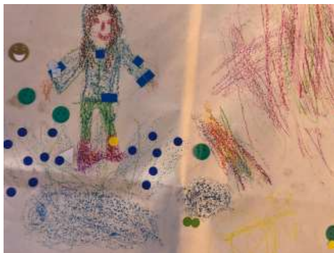
Detall del mural d'expressió infantil

Més enllà de la instal·lació efímera on la gent va penjar les seves aportacions en forma de targetes, es va generar un espai d'expressió destinat a infants mitjançant la creació d'un mural on podien dibuixar i/o escriure com veien la plaça i què els agradava. Una quinzena d'infants d'entre 4 i 12 anys va participar i les seves aportacions van ser les següents: la plaça com a lloc de joc (infants saltant bassals d'aigua a la zona de sorra), la biblioteca com a element destacable i demandes de més elements de joc.