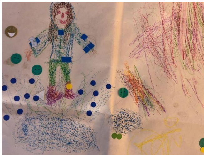
Detall del mural d'expressió infantil

Més enllà de la instal·lació efímera on la gent va penjar les seves aportacions en forma de targetes, es va generar un espai d'expressió destinat a infants mitjançant la creació d'un mural on podien dibuixar i/o escriure com veien la plaça i què els agradava. Una quinzena d'infants d'entre 4 i 12 anys va participar i les seves aportacions van ser les següents: la plaça com a lloc de joc (infants saltant bassals d'aigua a la zona de sorra), la biblioteca com a element destacable i demandes de més elements de joc.