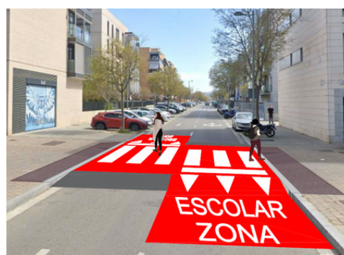
S'elevaran dos passos de vianants

El projecte està redactat, pendent d'aprovació.