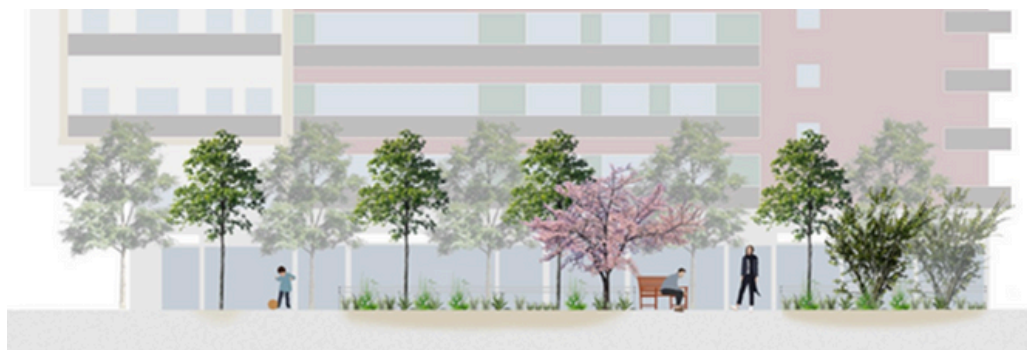
Proposta per la plaça dels Rabassaires

Als darrers Pressupostos Participatius van sortir escollits diversos projectes per millorar i dotar de més verd l'espai públic de Volpelleres.