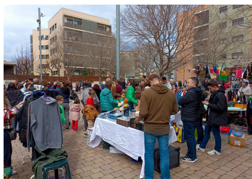
Primer Mercat de Segona Mà de Volpelleres

El Mercat de Segona Mà i Intercanvi de Volpelleres es va estrenar amb èxit al mes de març.