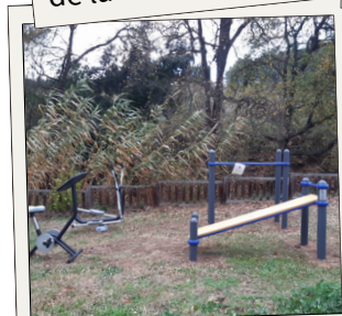
Gimnàs a l'aire lliure a Can Barata