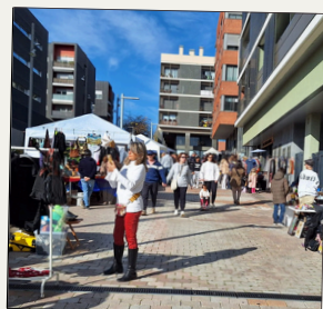
Mercat de segona mà a Volpelleres