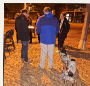
Accions per la tinença responsable d'animals

Dels 26 projectes escollits als Pressupostos Participatius del barri o d'àmbit general que s'ubiquen, en part, al barri, se n'han executat 15 .