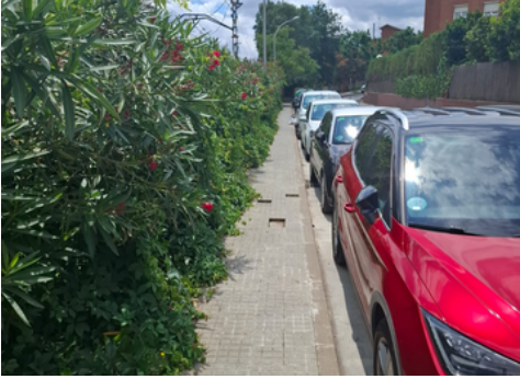
Carrer de Caldes de Montbui