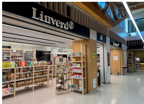
Nou establiment del Mercat de Volpelleres

El Mercat compta des del desembre amb un nou establiment: la botiga ecològica Lindverd, que ocupa sis parades.