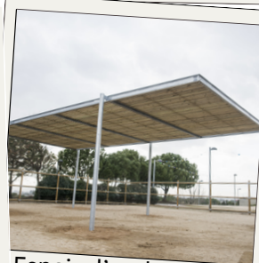
Espais d'ombra als parcs