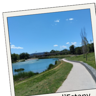
Condicionar l'Estany de la Guinardera