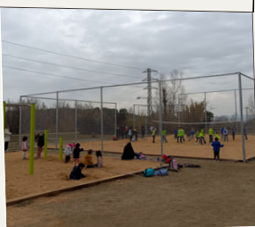
Millorar el parc de la Guineu