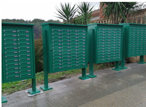
Les noves bústies es van instal·lar a la tardor

El veïnat de Can Barata compta amb un nou niu de bústies per garantir que el personal de correus pugui deixar la correspondència més fàcilment.