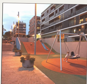
Millora de la zona lúdica de Benet Cortada