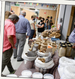
Accions per impulsar el Mercat de Volpelleres