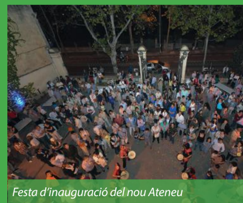
Festa d'inauguració del nou Ateneu

L'arribada de l'Ateneu a la Casa Jaumandreu ha convertit aquest edifici –sense ús des que el març del 2015 va deixar de ser la seu de la Policia Local– en un nou pol cultural i cívic de la ciutat . La inauguració oficial de l'Ateneu ha tingut lloc a començaments de curs amb un acte molt concorregut, que ha comptat amb una nodrida representació institucional i les actuacions de diverses entitats del municipi.