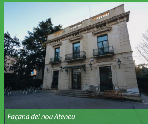
Façana del nou Ateneu

Gràcies a l'acord signat entre l'Ajuntament i l'Ateneu, aquesta entitat ha obert portes en una nova ubicació de Sant Cugat: la històrica Casa Jaumandreu, un edifici patrimonial situat a l'avinguda de Gràcia. El canvi d'emplaçament ha fet possible que l'Ateneu disposi d'unes noves instal·lacions, plenament adequades a les seves necessitats, i ha contribuït a dinamitzar el barri de l'Eixample Sud , que actualment allotja diversos espais culturals i educatius.