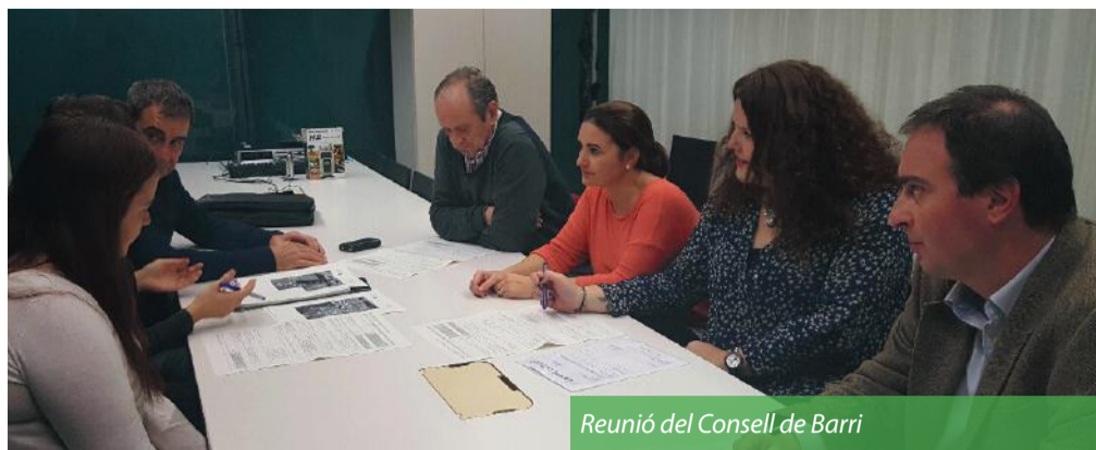
Reunió del Consell de Barri

Després de rebre i valorar les onze propostes presentades per part de les entitats i del veïnat, el Consell de Barri de Centre Oest ha acordat dur a terme els projectes viables, que seran finançats amb 14.500€. Són els següents: