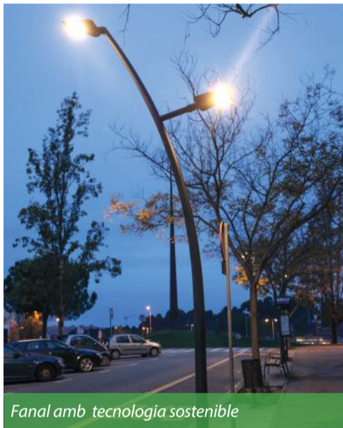
Fanal amb tecnologia sostenible

Durant els quatre anys que fa que s'està canviant l'enllumenat de Sant Cugat, la factura de la llum s'ha reduït d'un 35% i la previsió és arribar al 50% .