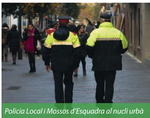
Policia Local i Mossos d'Esquadra al nucli urbà

Actuar contra els robatoris a domicilis i garantir la seguretat de la ciutadania és i serà una prioritat a Sant Cugat.