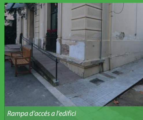
Rampa d'accés a l'edifici

Per fer possible el trasllat de l'Ateneu de la plaça de Pep Ventura a l'avinguda de Gràcia, l'Ajuntament ha arranjat l'accessibilitat de l'edifici i n'ha assegurat l'ús. És per això que s'ha suprimit les barreres arquitectòniques de la Casa Jaumandreu , s'ha creat un caminet i una rampa d'accés per a persones amb mobilitat reduïda, s'ha fet l'adequació del lavabo i s'ha instal·lat un elevador a l'edifici. A més a més, també s'ha instal·lat les mànegues contra incendis i s'ha adequat el llindar de les portes d'emergència de la planta baixa.