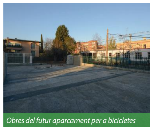
Obres del futur aparcament per a bicicletes

Els ciutadans que vulguin utilitzar aquest aparcament caldrà que es donin d'alta al web www.bicibox.cat . En el cas de les empreses que vulguin participar en el projecte Bi-Ti-Bi, caldrà que escriguin un correu a l'adreça mobilitat@santcugat.cat .